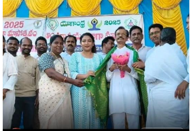
శ్రీకాకుళం జిల్లా వార్తలు.. వే2న్యూస్.లో డౌన్లోడ్

వేగవంతమైన నరసన్నపేట మండల వార్తల కోసం డౌన్లోడ్ మీ24న్యూస్ (Mee24News) యాప్