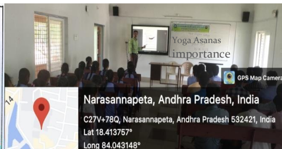
Exhibition on the importance of Yoga on 08-06-2025